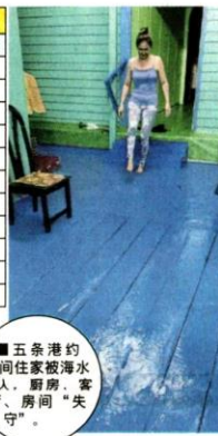
■五条港约20间住家被海水淹入，厨房、客厅、房间“失守”。