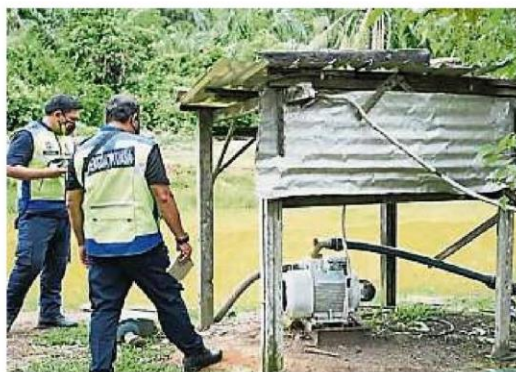
执法组指示业者, 要尽快维修好畜牧场的排污池。