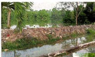
■英达岛一带海水倒灌，是路、是河已经分不清了。