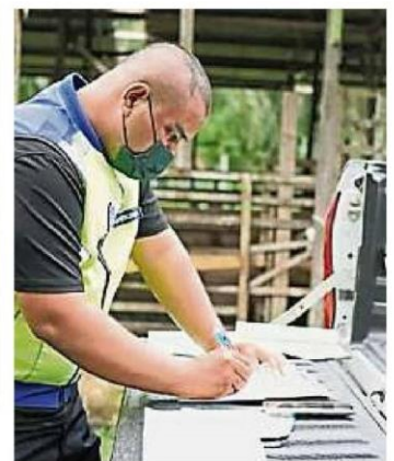
由于畜牧场排污不当, 有关单位援引条例开出两张违规信给业者。