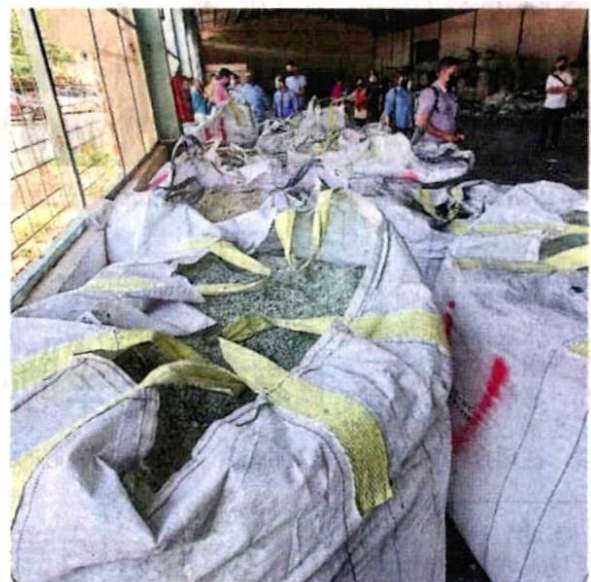
■峇冬加里附近一间仓库被指没有妥善处理受管制废料和工业废料。

（莎阿南7日讯）峇冬加里附近一间仓库没有妥善处理受管制废料和工业废料，雪州环境局已采集相关样本，送往大马化学局分析其成份。