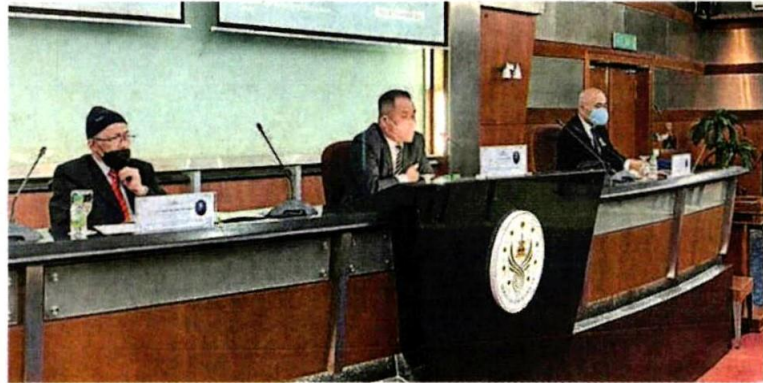
■雪州能力、公信力与透明度特别遴选委员会针对瓜冷市议会新办公大楼召开会议。