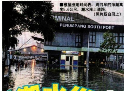
■根据涨潮时间表，周四早的海潮高度5.6公尺，潮水淹上道路。