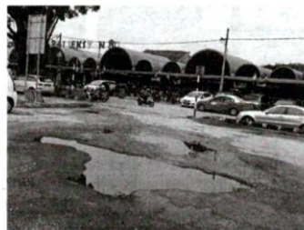
KEADAAN lopak besar di hadapan Gerai Makan Seksyen 8 yang masih wujud walaupun aduan dibuat enam bulan lalu.