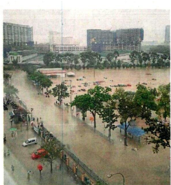
一场豪雨让莎阿南多区淹水数小时。(摘自网络)

项解决雪州淹水的排水道工程，而水利灌溉局已通过第 11 大马计划，完成了 78 项工程，涉及 4 亿 2523 万令吉。