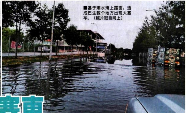
■基于潮水淹上路面，造成巴生数个地方出现大塞车。（照片取自网上）