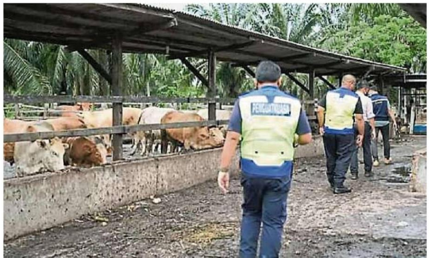
雪州水务管理机构接获兽医局的投报后, 立即派人到畜牧场检查。

雪州水务管理机构呼吁民众, 若发现可疑或潜在引起水源污染事件, 可立即向当局举报, 以免水源污染事件再度发生。