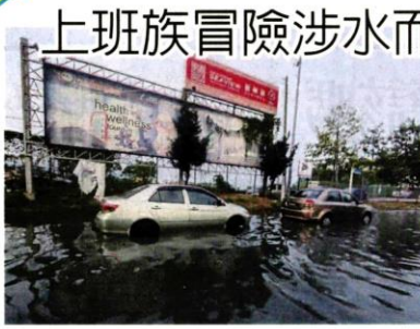
■水淹至半个车胎，上班族为免迟到而冒险涉水而过。

根据李富豪出示的涨潮时间表，今日的涨潮时间为早上8时30分，海潮高度是5.6公尺。