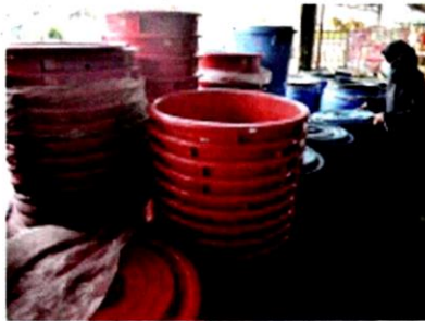
Luezita menyusun tong-tong air di kedainya yang semakin mendapat sambutan susulan gangguan bekalan air berjadual 13 Oktober ini.

SHAH ALAM - Susulan pengumuman gangguan bekalan air di sekitar Lembah Klang pada 13 Oktober ini, orang ramai dilihat mula membuat persiapan dengan membeli tong simpanan untuk kegunaan mereka.