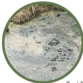
← 畜牧场因排放牛羊排泄物入河, 造成水源污染。